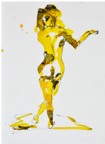
© Phil Meyer - Femme, banane , 2017