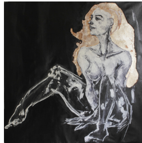
© Phil Meyer - Sominio , 2018